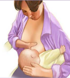
Futbol Tutuşu Pozisyonu